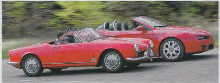
Es ist vor allem das höhere Gewicht der Neuwagen, das die Fortschritte im Motorenbau zunichte macht. Der Alfa Romeo Giulietta Spider wiegt 860 Kilo, sein Enkel bringt 1608 Kilo auf die Waage. In unserem Test verbrauchte der Oldtimer 6,9 Liter, der Neuwagen 11,2