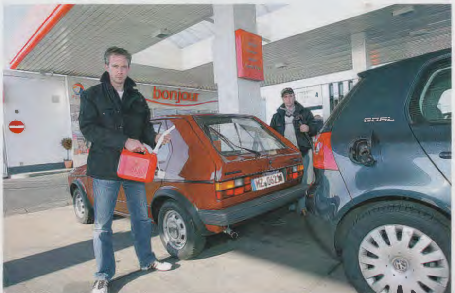
Auch bei den Dieseln hatte der Alte die Nase vorn: Der Golf I D nippte 6,03 Liter, der Golf V TDI gab sich mit 6,83 Litern zufrieden. Auch hier ist der Gewichtsunterschied bemerkenswert: 900 Kilo beim Golf I, 1250 Kilo beim Golf V

Da gibt es auf Seiten der Kunden offenbar noch Aufklärungsbedarf. OLDTIMER MARKT stellte bei einer kleinen Umfrage in der Mainzer Innenstadt fest, dass rund drei Viertel der Befragten glaubten, die Hersteller seien in ihren Prospekten zu Angaben verpflichtet, die bei ruhiger Fahrweise auch in der Praxis erreichbar seien. Dementsprechend gab es immer wieder erboste Neuwagenkäufer, die sich beim Spritverbrauch genept sahen. Die Klage-