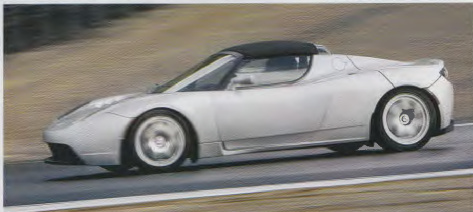
Mit 238 PS in vier Sekunden von Null auf 100: Über 6000 Lithium-Ionen-Akkus machen den Tesla Roadster zum ernstzunehmenden Sportwagen. Doch sein Elektromotor verlagert die Emissionen lediglich von der Straße ins nächstgelegene Kraftwerk

die leichte Aluminiumkonstruktion für die Katz. Der Umkehrschluss: Je länger ein Fahrzeug auf der Straße bleibt, desto mehr rechnet sich der Produktionsaufwand auch für die Umwelt.